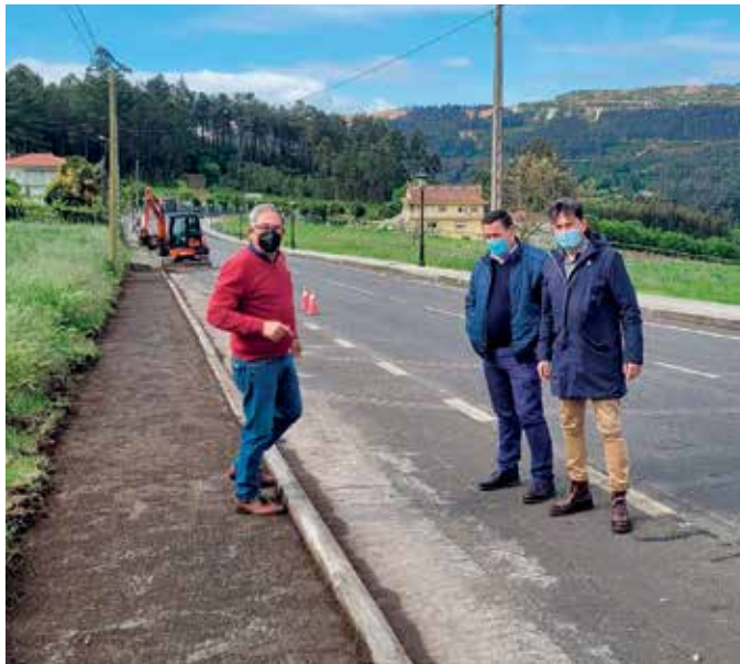
O alcalde de Boqueixón, no centro, durante a súa visita ás obras da senda

As obras de mellora da seguridade viaria na estrada provincial DP-1201, entre Rodiño e Codeso, xa están en marcha. Os traballos comprenderán, entre outros aspectos, a creación dunha senda peonil entre ambos os dous núcleos de poboación, cumprindo, deste xeito, cunha antiga