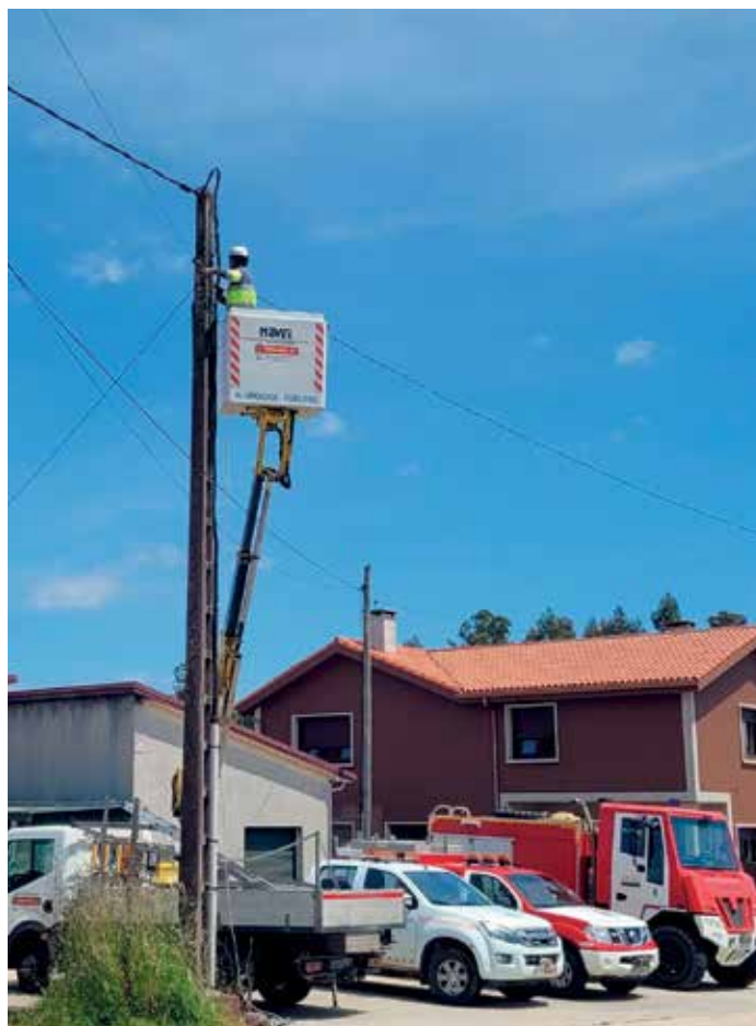
Un operario levando a cabo a substitución dunha das luminarias de O Forte

A actuación está acollida á liña de axudas a proxectos de Economía Baixa en Carbono promovidos por Entidades Locais, cofinanciada polo Fondo Europeo de Desenvolvemento Rexional (FEDER) e xestionada polo Instituto para a Diversificación e Aforro da Enerxía (IDAE), co obxectivo de conseguir unha Economía máis limpa e sostible. Do montante total do orzamento, o Concello aporta un 20%, mentres que o resto será asumido polo IDAE.