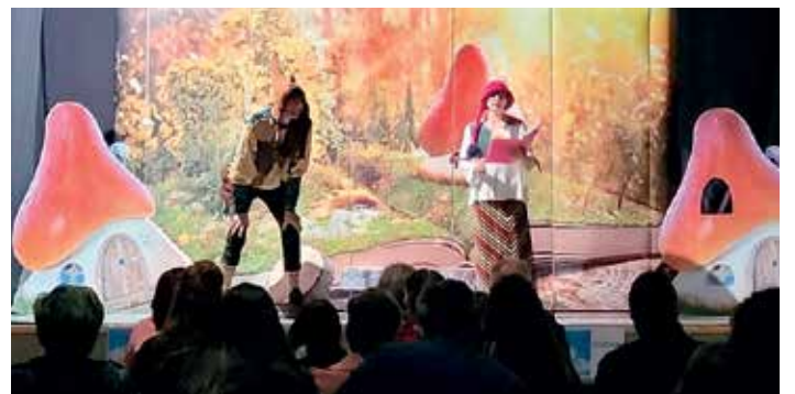
Actuación da compañía Duende Sico, que ofreceu a obra A mestra da lingua