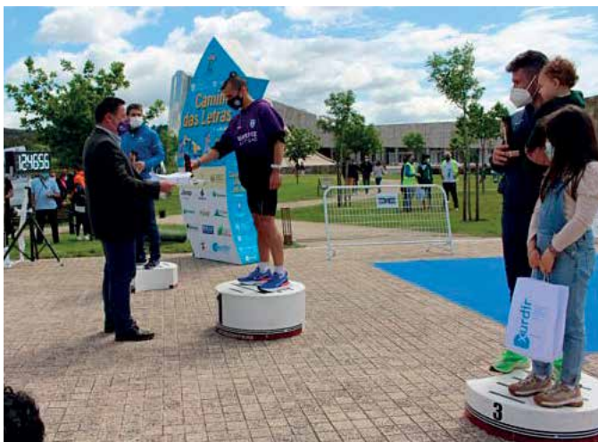
O alcalde de Boqueixón na entrega de galardóns realizada na Cidade da Cultura

Axudas para adquirir libros de texto e material escolar para o vindeiro curso