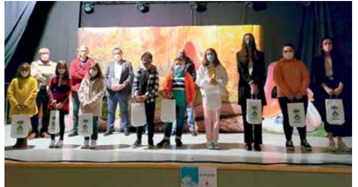
Rapazas e rapaces premiados/as no VII Certame de relato curto 'Xosé Neira Vilas'

O Festival das Letras Galegas completouse cunha lectura dramatizada de textos de Xosé Neira Vilas a cargo de Elisa Barreiro.