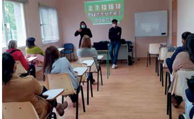
Un intre da charla sobre o abuso das novas tecnoloxías, en Camporrapado

A xornada foi impartida por profesionais dun gabinete psicolóxico de Santiago. Nela, abordáronse os principais perigos que supoñen as novas tecnoloxías. Así, fíxose fincapé