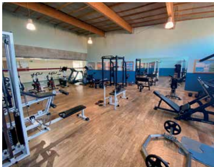
Vista da sala de musculación do ximnasio municipal, que reabre as súas portas

Pola súa banda, os distintos grupos de clases dirixidas contarán cun máximo de 6 persoas en interior, e