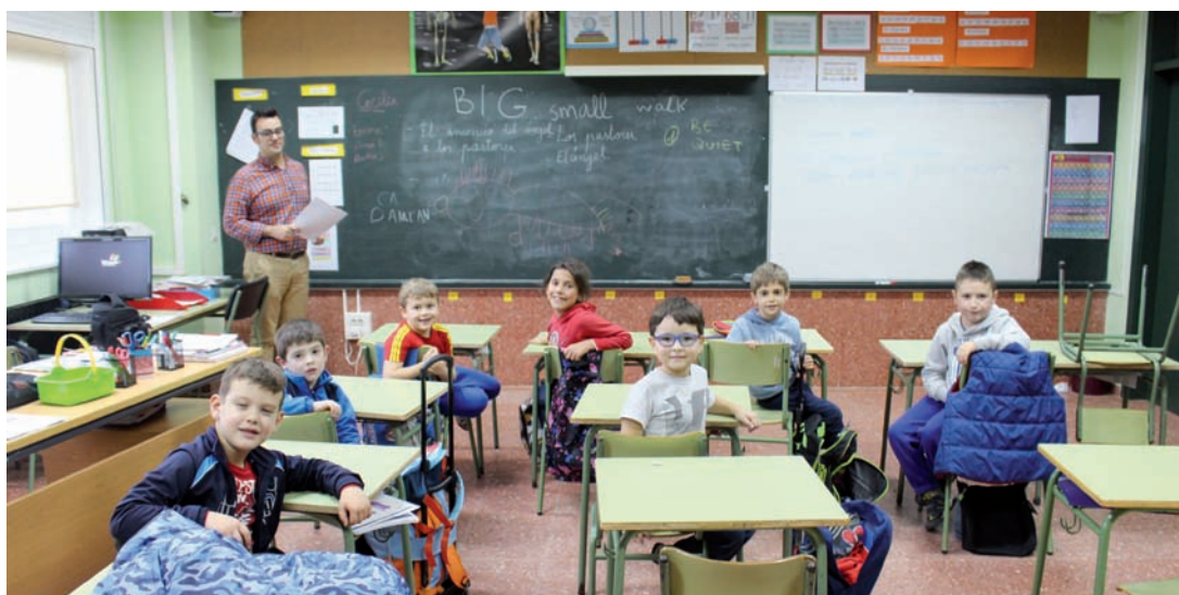
A formación está impartida por profesorado nativo

A formación é impartida por academias homologadas para a preparación das probas de Cambridge, con grupos reducidos e unha metodoloxía activa-participativa que permite unha atención máis individualizada, de cara a adquirir máis eficazmente as competencias esixidas (comprensión auditiva, comprensión lectora, interacción oral e expresión escrita).