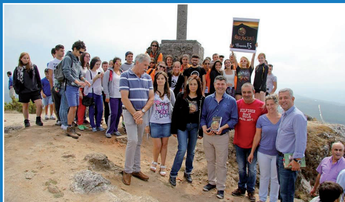
Presentación do II Campo de traballo Dragal

A Dirección Xeral de Xuventude, Participación e Voluntariado en colaboración co Concello de Boqueixón e coa Secretaría Xeral de Política Lingüística, celebrou na primeira quincena de agosto o II Campo de Traballo Dragal.