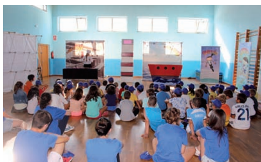
Nenos e nenas gozando dunha das actividades incluídas na programación de Verán Activo

Coas vacacións do verán chega o período de máis actividades de ocio e entretemento para a poboación infantil e xuvenil, coas que se pretende unha ocupación positiva do tempo de lecer á vez que se facilita a conciliación da vida laboral e familiar.