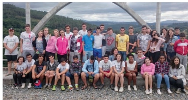
Mozos e mozas participantes na Escola de Verán

Dentro da programación para os rapaces e rapazas máis maiores cabe destacar o Campamento de Verán e a Escola de Verán, actividades éstas promovidas pola Oficina de Información Xuvenil e realizadas conxuntamente cos veciños concellos de Vedra e Vila de Cruces.