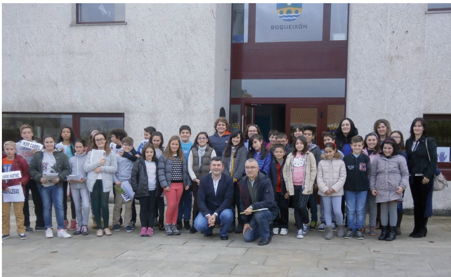
Foto de familia dos protagonistas do 1º Pleno Infantil xunto co alcalde e a concelleira de Servizos Sociais

Estes rapaces contaron cun público de excepción, os seus compañeiros de 5º de primaria.