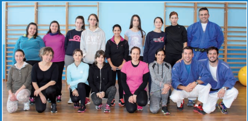
Participantes e mestres do curso de defensa persoal

Con motivo do 25 de novembro, día Internacional contra a Violencia de Xénero, o CIM de Boqueixón, puxo en marcha un curso monográfico de defensa persoal feminina, destinado a mozas e mulleres maiores de 14 anos.