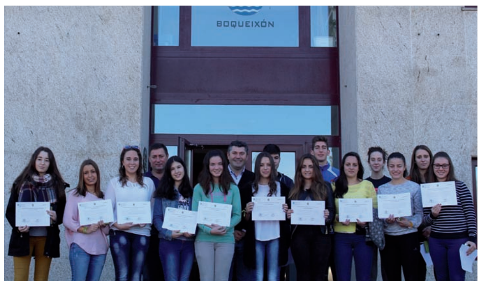
Entrega de diplomas “Deseñando o teu futuro”

As opinións foron unánimes, resultados moi positivos e experiencias moi produtivas que axudaron a definir as expectativas de futuro dos nosos rapaces.