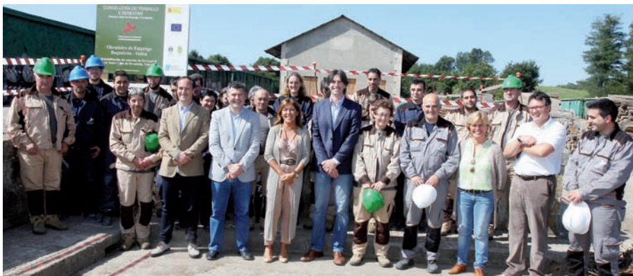
A conselleira cos participantes no obradoiro e os alcaldes de Boqueixón e Vedra.

Durante este período os participantes traballarán na rehabilitación da estación de ferrocarril de Santa Cruz de Ribadulla de Vedra, así como en diversas melloras en lugares públicos de Boqueixón: casa da cutura de Camporrapado, a praza pública de Sergude, o camiño interior de Outeiro en Codeso e o camiño interior de Xiadás en Gastrar.