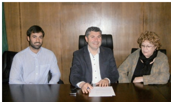
O equipo de profesionais xunto co alcalde na firma do convenio.

das nenas para mellorar as súas capacidades de comprensión, aprendizaxe e conducta traballando os aspectos que dificultan a adquisición de habilidades e pautas socioeducativas.