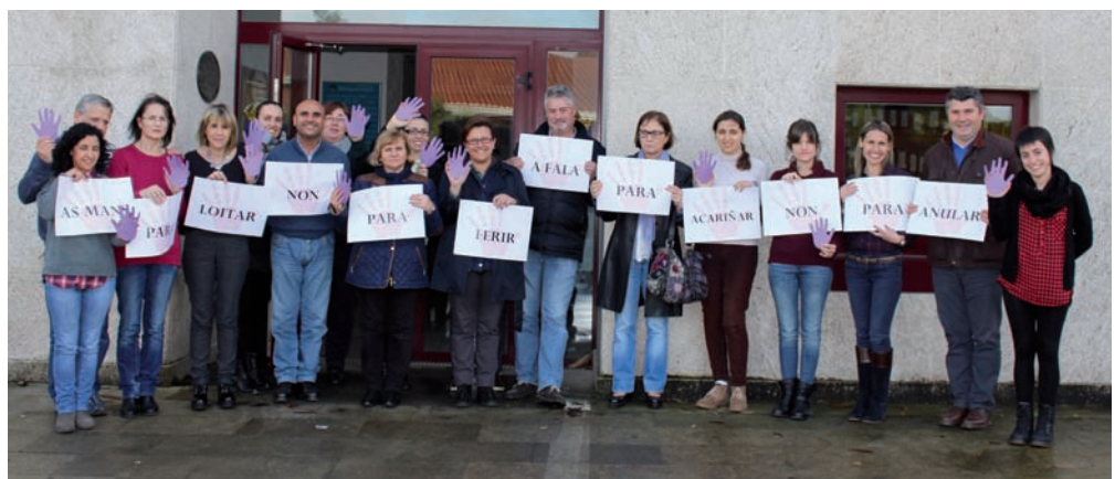
Traballadores do Concello o día 25 de novembro

ha man violeta, símbolo da loita contra a violencia machista.