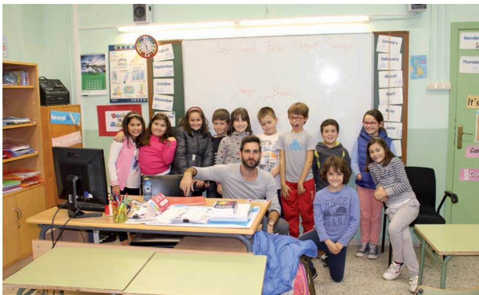
Un dos grupos con maior número de participantes

O Marco Común Europeo de Referencia establece o seguinte cadro de equivalenzas: