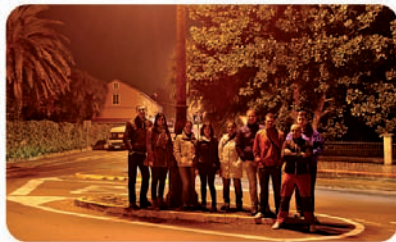
ACTIVIDADES FORMATIVAS XUVENTUDE