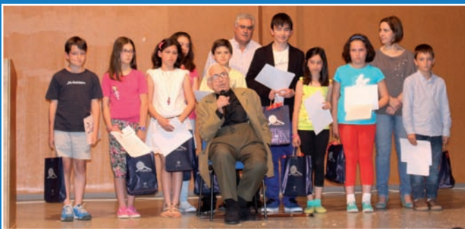
No acto de entrega dos premios aos mellores relatos contouse coa presenza do ilustre escritor e Fillo Adoptivo de Boqueixón, Xosé Neira Vilas.

O Departamento de Educación e Cultura e a biblioteca municipal de Boqueixón organizaron o I Certame de Relatos "Xosé Neira Vilas", co obxectivo de potenciar a lectura e a creatividade literaria e fomentar valores como a liberdade, o respecto e a tolerancia.