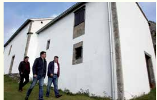
O conselleiro de Cultura, Román Rodríguez, visita as obras de conservación na capela de San Sebastián

Por outra banda, levarase a cabo unha profunda rehabilitación do Centro de Interpretación do Pico Sacro, situado no lugar de Cachosenande. Así, substituirase a carpintería das fiestras, recuperarase o chan da planta baixa do