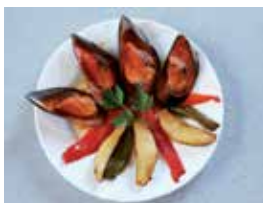
'Os Tigres', Bar A Barreira