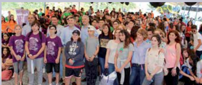
Alumnos e alumnas de diversos centros participaron nesta xornada