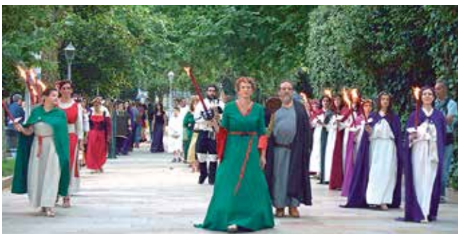
Participantes na representación