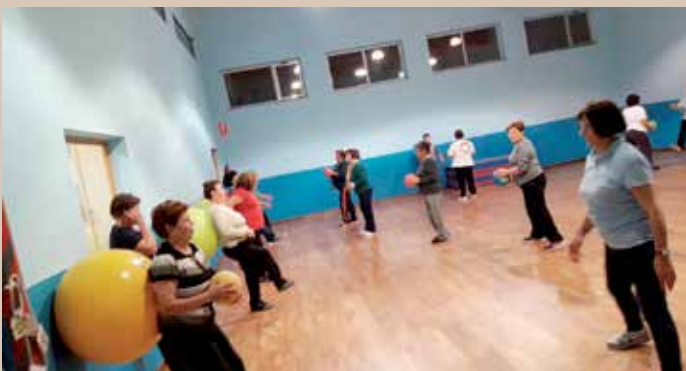
Ximnasia para maiores nos distintos centros socioculturais

O congreso serviu para atopar moitos maiores activos e moi interesados na aprendizaxe das novas tecnoloxías, así como coñecer persoas con obxectivos afíns a este programa municipal. De feito, un dos participantes no congreso, da Universidade de Alacante, resultou ser da parroquia de Sergude e amosouse moi interesado polo traballo que se leva a cabo no seu municipio natal.