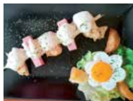
'Espetada de ouro', Café Bar Latino