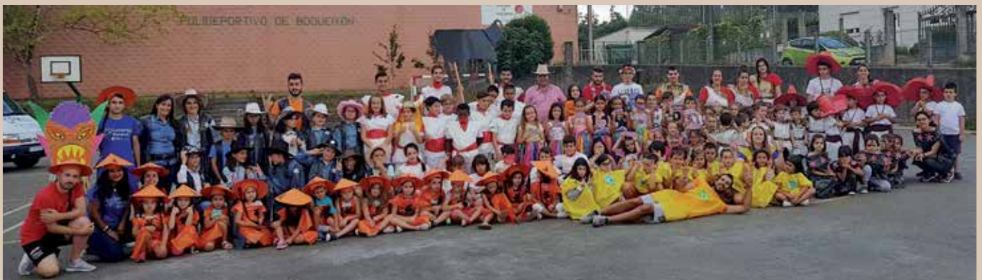
A cativada de Boqueixón gozou dunha Acción de Verán repleta de variadas actividades de lecer durante as mañás dos meses estivais