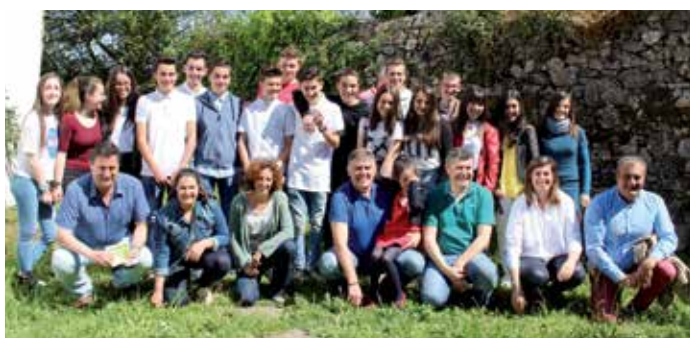
Alumnado participante no programa "Recicla Boqueixón"

Unha campaña porta a porta na que se distribuíu un díptico informativo e que se complementou con xornadas de sensibilización nas feiras de Lestedo e Rodiño, e co reparto de carteis nos comercios e xogos para os nenos/as de Primaria. A maiores, o Concello instalou novos colectores de recollida selectiva nas parroquias.