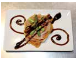
'Timbal agridoce de xamón e tomate', O Improvisto