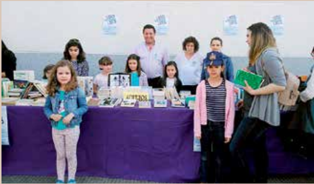
O alcalde de Boqueixón durante a Feira do Libro en Lestedo