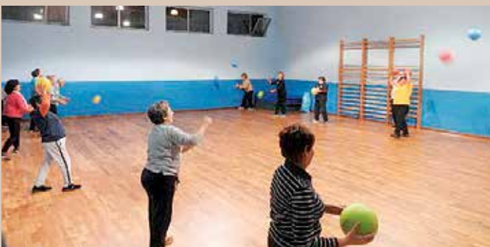
Unha das sesións que se desenvolven dentro do plan 'Galicia Saudable'