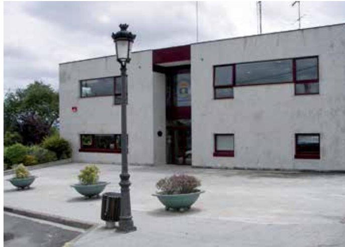
O Concello de Boqueixón continúa coa senda de reducir o gravame impositivo aos veciños e veciñas do municipio

Isto terá como consecuencia práctica que os veciños e veciñas con propiedades inmóveis como casas, palleiros, industrias ou outras construcións pagarán un recibo moi similar