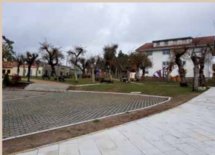
Melloráronse as beirarrúas para evitar resbalóns os días de choiva

As obras realizadas consistiron na plantación de céspede natural en toda a zona e o acondiciona-