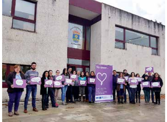
Participantes na campaña “O photocall pola Igualdade”

Ademais da lectura dun manifesto de repulsa contra a violencia machista e de compromiso de loita para a súa erradicación, o Concello desenvolveu a campaña “O photocall pola Igualdade”, unha iniciativa para recordar os límites e os dereitos nas relacións de parella, clave fundamental para a prevención de relacións tóxicas e a construción de relacións saudables.