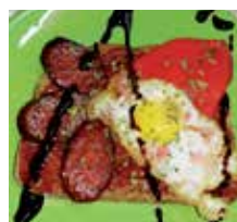
'Caralludo', Café Bar O'26