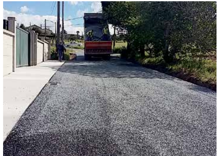
O Concello de Boqueixón destina a obras sete de cada dez euros do POS+2107, o que supón un investimento de 447.000 euros