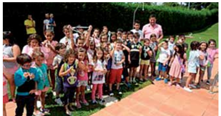
O rexedor boqueixanés, coa rapazada asistente aos cursos de natación

As distintas actividades propostas aos máis pequenos e pequenas do municipio buscaban mellorar as súas habilidades motrices dentro da auga, fomentando deste xeito o seu desenvolvemento neste medio.