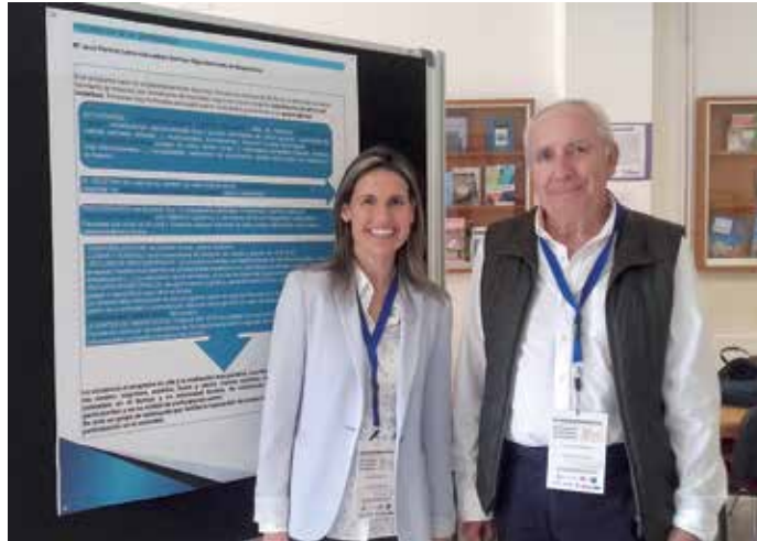
Boqueixón no XV Encontro de Programas Universitarios para Maiores

Na actualidade, o servizo de axuda no fogar do Concello de Boqueixón conta cun total de 56 usuarios, 48 deles, na modalidade de dependencia,