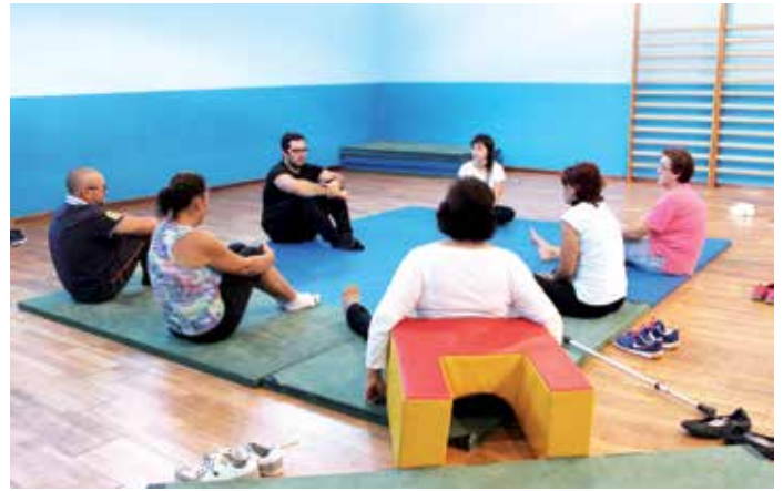
Unha das sesións do grupo de apoio deste programa municipal

De feito, o programa CoidarNos foi seleccionado dentro da sección de comunicacións de experiencias dentro da IV Conferencia Nacional del Paciente Activo. Esta cita