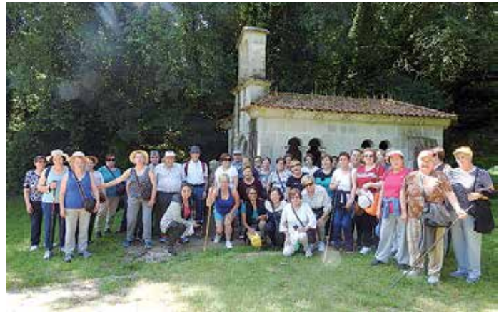
O amplo grupo de veciños e veciñas que participou na III Andaina

A xornada de deporte e cultura finalizou cun almorzo de confraternidade. Todos os asistentes quedaron emprazados a continuar desenvolvendo a súa capacidade física a través das sesións de ximnasia de mantemento no concello.