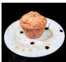
'Monte Sacro', Rte. Vente Vindo