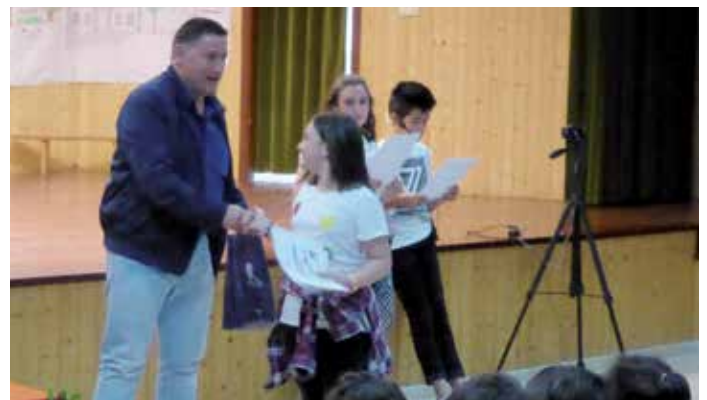
O alcalde de Boqueixón, entregando un dos galardóns

O Concello de Boqueixón editará unha publicación na que se reproducirán todos os traballos gañadores neste certame. O seu obxectivo é potenciar a lectura e fomentar a creatividade literaria dos escolares boqueixaneses.