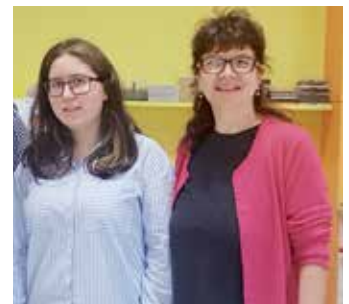
Dous dos mozos boqueixaneses participantes no Galeuropa