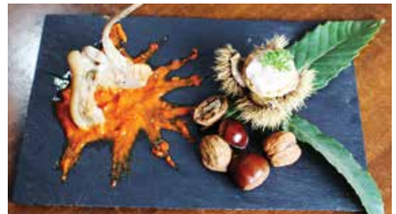
A 'Costeleta de cordeiro con salsa de inverno' de A Taberna d'San Benito acadou o terceiro galardón