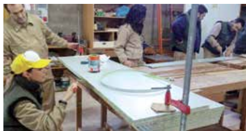
A formación e os traballos nas especialidades de carpintería e moble teñen lugar en Camporrapado