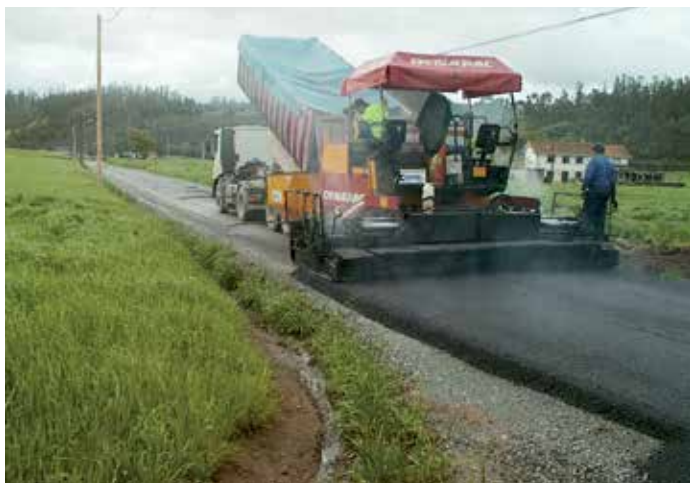
O Concello de Boqueixón aglomerará un total de 9,9 quilómetros de estradas, rúas e travesías nos anos 2017 e 2018

A previsión do Goberno local é poder comezar a licitar estas obras antes do verán de 2018, de modo que se poidan comezar a executar antes de que finalice o ano.