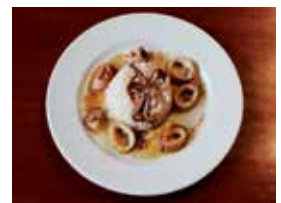
'Niño de luriñas', Café Bar 'Casa Agrelo'