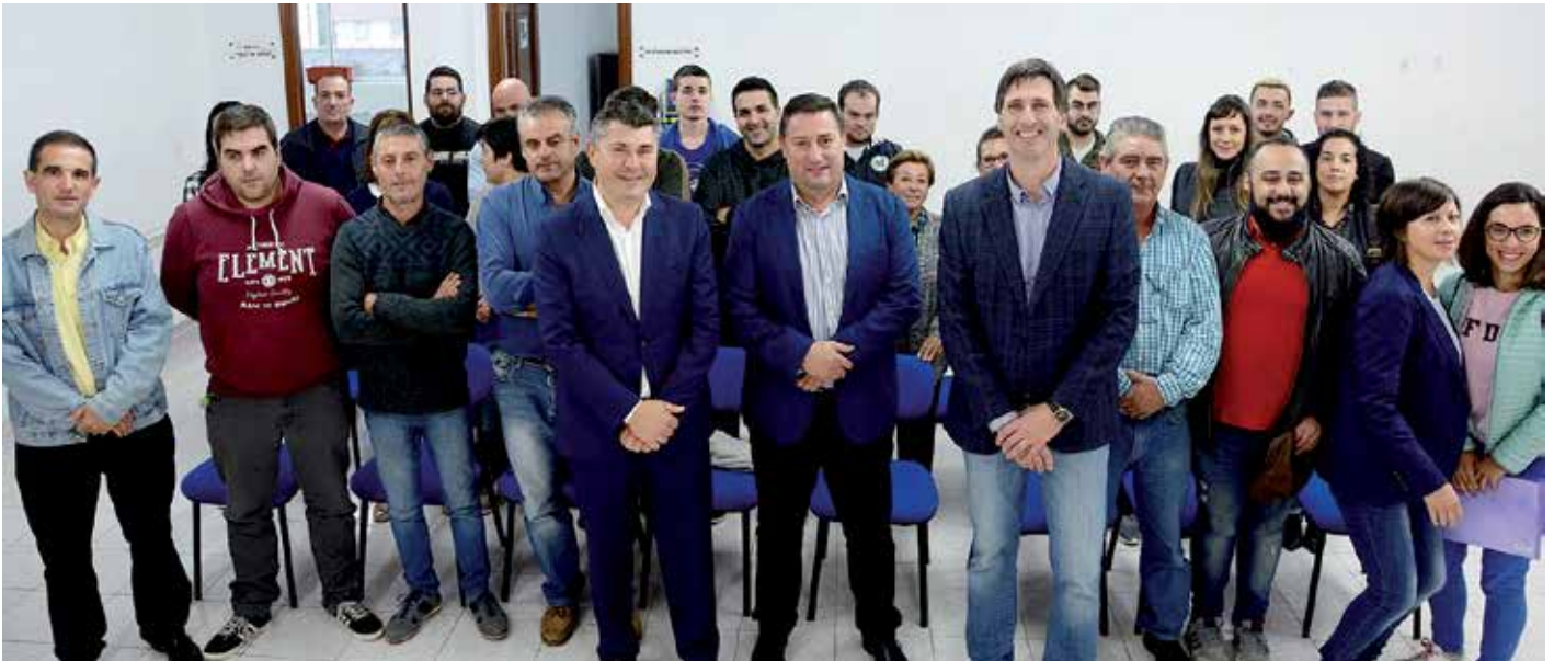
Os alcaldes de Boqueixón e Vedra e o delegado da Xunta na Coruña acompañaron ao alumnado na presentación do obradoiro