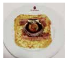
'Vieiriña peregrina', Rte. Vía da Prata