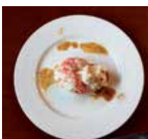
'Picado de gambas', Café Bar 'Casa Agrelo'