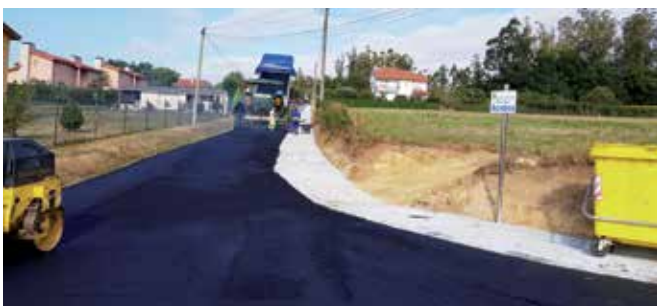
Obras de aglomerado dos 260 metros da rúa dos Acebos

Estas obras están incluídas no Plan Hurbe, unha iniciativa da Xunta para dar resposta ás necesidades de humanización de rúas e á urbanización e mellora dos espazos públicos.