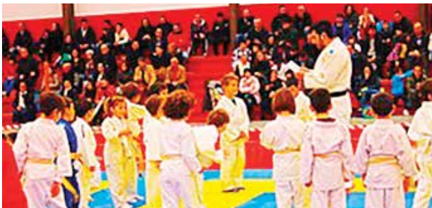
Algúns dos participantes na segunda edición do Torneo de ludo

tesala das vodas de prata do Torneo. Este campionato municipal xa se converteu nunha xuntanza de veciños arredor dun feito lúdico e de lecer como é o deporte.