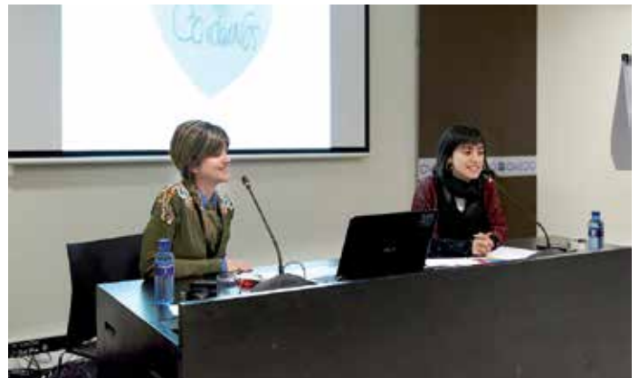
Un intre da presentación de CoidarNos no congreso en Oviedo

desenvolveuse o pasado 4 de marzo no Palacio de Congresos de Oviedo.