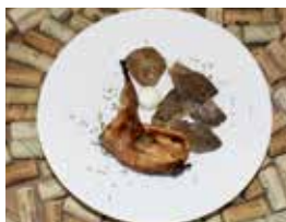
'Paspallás confeitada e froitos de tempada', Casa Castro