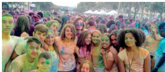
Os participantes tamén gozaron das propostas de lecer da illa