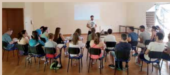
Asistentes ao Curso de Monitor/a de Piragüismo

Máis dun cento de mozos e mozas boqueixaneses participaron durante este ano nas actividades incluídas dentro do Programa de Información e Dinamización Xuvenil Emprendedora desenvolvido polos concellos de Boqueixón, Vedra e Vila de Cruces. O principal obxectivo das accións postas en marcha foi promover entre a xuventude a adquisición das competencias necesarias para