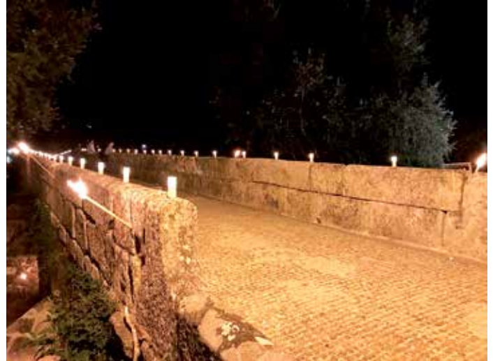
A Noite Velada encheu a ponte románica de Ledesma de candeas

Todo para contar cunha ponte románica que sirva de referente e de escenario para accións culturais coma a desenvolvida en setembro coa Noite Velada. Numerosos veciños e veciñas acudiron a esta cita na que se mesturaron as actuacións de Campo de Estrelas, Son de Gaita e Os Carunchos, co conxuro da queimada e postos con bebida e comida.