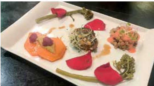
'Os sete pecados' de O Rincón de Pepe foi a vencedora da VI Ruta de Tapas 'Que rico estás Boqueixón'

200 € en metálico, 5 botellas mágnium da Bodega Pazo do Mar, 4 estoxos de botellas de Bodegas Lodeiros e un vale de 120 € para un xantar ou cea canxeable nun dos establecementos participantes.