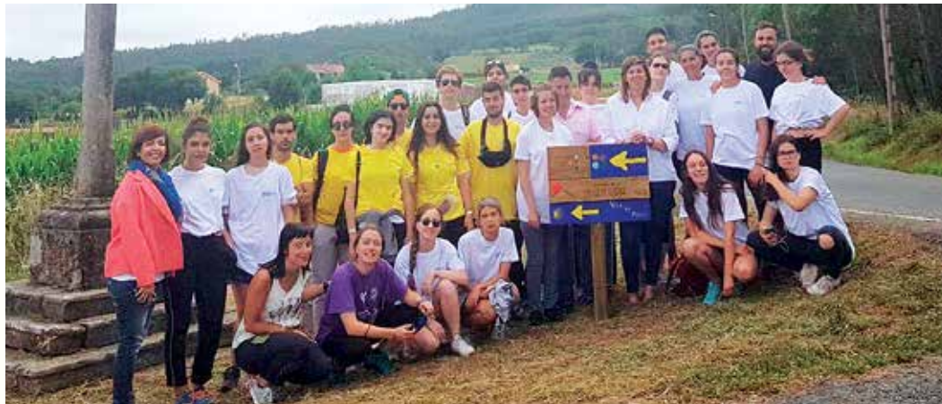
Foto do grupo de voluntarios europeos que participaron no campo de traballo xunto coas autoridades

Por outra banda, o grupo elaborou materiais divulgativos cos que se enfatiza o valor do Pico Sacro como referente cul-