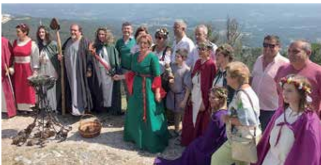
Un intre da cerimonia do lume sagrado celebrada no Pico Sacro

ten retirar niños en alturas de ata 28 metros. Lembra que para avisar para a retirada dun niño só tes que chamar ao 112.