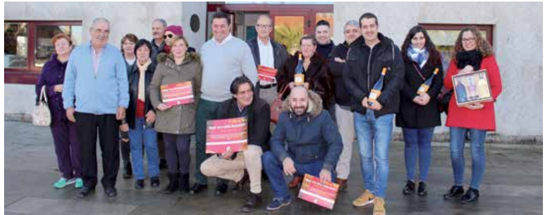
Foto de familia tras a entrega de premios a establecementos e clientes da VI Ruta de Tapas

Casa de Xantar O Improvisto, Café Bar Latino, A Taberna d'San Benito, Café Bar A Barreira, Casa de Xantar Casa Castro, Casa Agrelo, Restaurante Vente Vindo, Café Bar O Rincón de Pepe, Cervexería O Vikingo, Café Bar O'26 e Restaurante Vía da Prata foron os participantes nesta cita desenvolvida oos días 24, 25 e 26 de novembro e o 1, 2 e 3 de decembro. Cada tapa tivo un prezo de 1,5 euros.