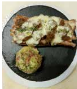
'Airiños do Pico', de O Vikingo segundo premio