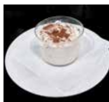
'Boqueixo-marmelo', Rte. Vente Vindo