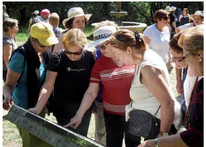
O percorrido por esta ruta en Meis estendeuse sete quilómetros