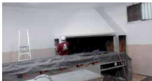
O alumnado está desenvolvendo traballos de acondicionamento do local social de Lestedo