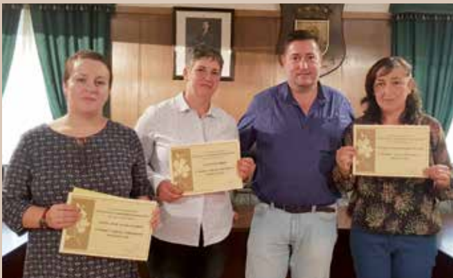
Gañadoras da primeira edición do Concurso de Xardineiras