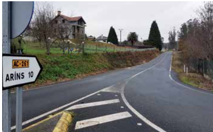
O Concello xa mellorou a AC-261 ao seu paso polo municipio

Así, a Xunta vai estender una nueva capa de rodadura entre los quilómetros 3+510 e 5+960 para aca-