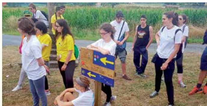
Un dos sinais creados e instalados no campo de traballo 'Pico Sacro'

tural e patrimonial de primeira orde. Ademais, os 17 mozos europeos participantes crearon dúas rutas interpretativas con información e actividades que se poden desenvolver tanto no Pico Sacro coma nas Illas de Gres en Ponteledesma. Estes materiais complementáronse cun amplo dossier fotográfico.