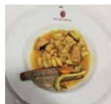
'Fabada Mariñeira', Rte. Vía da Prata