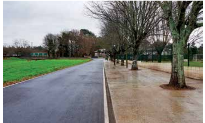
O plan HURBE comprendeu, entre outras actuacións, o arranxo dos accesos ao campo de fútbol da Siveira, en Camporrapado

Na parroquia de Oural, os traballos consistiron na pavimentación da Travesía de Camporrapado e a instalación dunha canalización para a recollida de augas pluviais. Na trave-