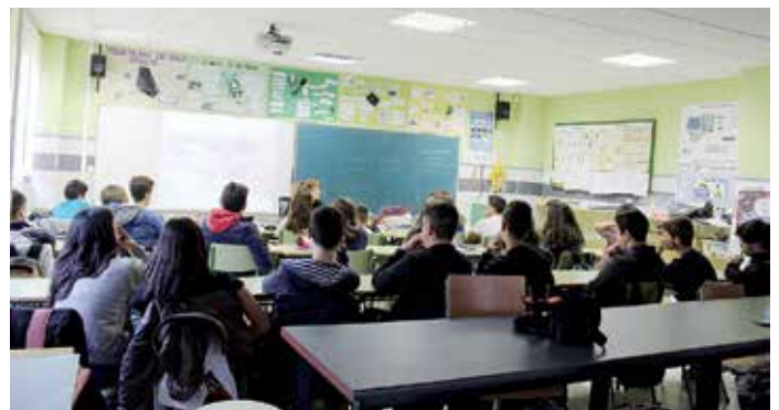
O Concello colabora co colexio en actividades de igualdade de xénero

Nesta charla, incluída nas actuacións que promoven a Secretaría Xeral da Igualdade e a FEGAMP, participaron 26 mozas e mozos de 3º da ESO, que recibiron información sobre manifestacións da violencia machista, estereotipos, micromachismos e mitos. A maiores, o CIM de Boqueixón organizou un ano máis no colexio o “Obradoiro de Prevención da Violencia de Xénero en Adolescentes”.