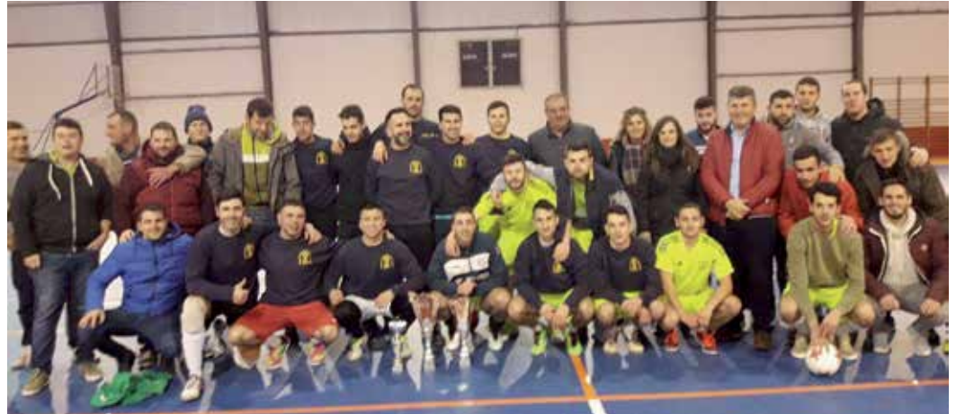
Foto de familia de participantes na vixésimo cuarta edición do Torneo Interparroquial de Boqueixón

Os equipos dividíronse en dous grupos. No A estiveron os membros de 'Feitizo', 'A barra é nosa' e 'Vente Vindo'. Pola súa banda, o Grupo B estivo composto por 'Bo Nadal', 'Lestedo-Campos' e 'Herdeiros da Estaca'.