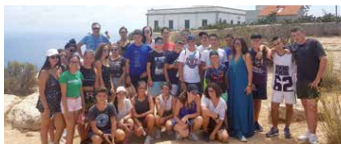
Unha das visitas culturais realizadas dentro do intercambio xuvenil

Unhas experiencias que resultaron un éxito de participación e que se animan a seguir organizando accións deste tipo.