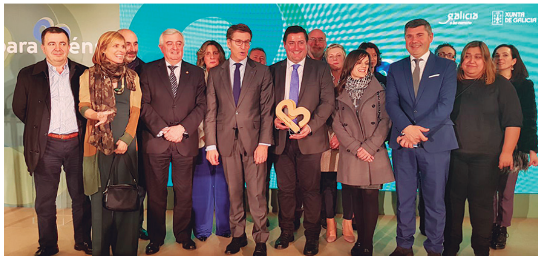
Foto de familia de autoridades tras a entrega dos Premios Galicia Parabéns, convocados pola Axencia Galega de Turismo

O proxecto premiado co Galicia Parabéns, e dotado con 388.000 euros, inclúe varias actuacións no Pico