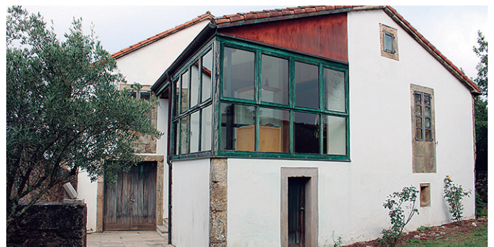
Unha das próximas actuacións prevé melloras no centro de interpretación