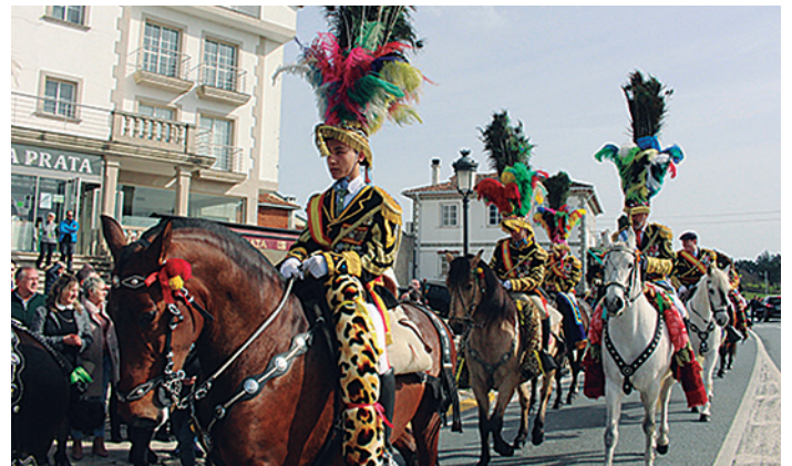
A xornada ofreceu un vistoso desfile de máis de corenta Xenerais da Ulla

O programa da Festa complementouse coas Xornadas Gastronómicas da Filloa, que rexistraron un grande éxito de convocatoria entre os días 12 e 17 de febreiro. Nelas participaron oito os establecementos hostaleiros das parroquias de Sergude e Lestedo: A Taberna d' San Benito, Casa de Xantar Casa Castro, Café Bar Casa Agrelo,