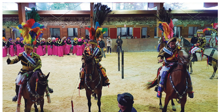
Un intre da celebración do Entroido de Sergude no Centro do Cabalo Galego

Os vivas escoitáronse tanto no Centro do Cabalo Galego coma no campo da festa de Sergude. Neste último, os Xenerais da Ulla afiaron as súas espadas -e linguas- para entonar o seu atranque.