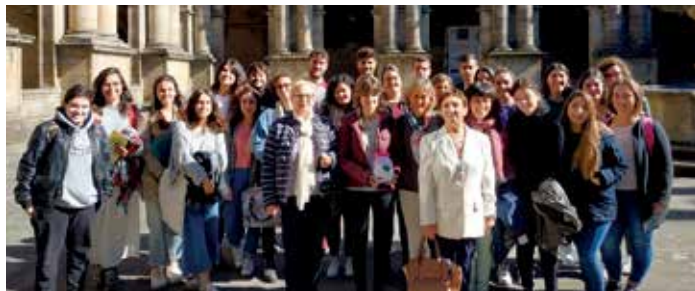
Persoal do programa CoidarNos co alumnado da Escola de Traballo Social da USC

As dúas profesionais estiveron ademais acompañadas por 4 das persoas coidadoras que conforman esta actividade. O seu testemuño permitiu facer visible a realidade das persoas coidadoras e a valoración da súa participación no programa.