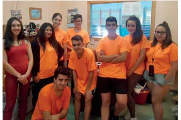
Mozos e mozas de Boqueixón participantes no programa de voluntariado

O terceiro eixo de acción xuvenil, e o que rexistrou meirande número de participantes, centrouse na posta en marcha de accións de animación e desenvolvemento comunitario. Máis concretamente, participarán moi activamente nos diversos plans de conciliación estivais, ademais de colaborar no desenvolvemento de propostas específicas de lectura. Entre eles, cómpre salientar a colaboración prestada polas voluntarias e voluntarios no Verán Activo, unha proposta de