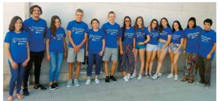
O programa tamén inclúe unha formación continua para a mocidade

lecer que se desenvolve durante os meses do verán.