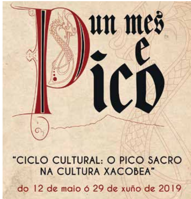
Cartel de 'Un mes e Pico. Ciclo Cultural: O Pico Sacro na Cultura Xacobeá'

Pico. Ciclo Cultural: O Pico Sacro na Cultura Xacobeá darase a coñecer o sábado 12 de maio no acto de presentación que terá lugar na Capela de San Sebastián ás 11.30 horas. A apertura contará coa presenza do alcalde boqueixanés, Ma-