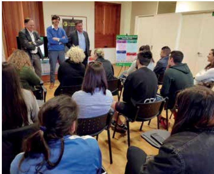
Os tres alcaldes asistiron a unha das accións formativas do programa Val do Ulla

O programa de dinamización xuvenil Val do Ulla levarase a cabo a través do reforzo das canles de co-