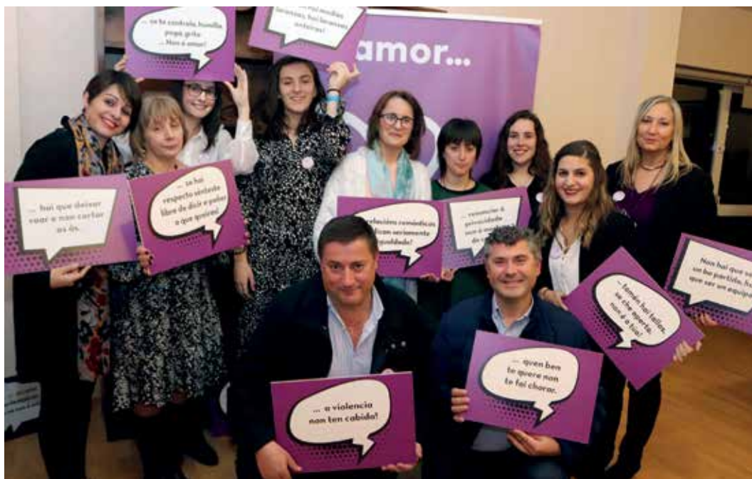
O acto central da programación especial con motivo do 25N foi a I Xornada de Sensibilización en Violencia contra a Muller

Paralelamente a esta actividade, o CIM de Boqueixón puxo en marcha a campaña de concienciación Malva contra a violencia entre o comercio local con motivo do 25-N. Así, repartíronse bolsas de compra e cartelería entre os distintos establecementos comerciais dos municipios de Boqueixón, Touro e Vedra –