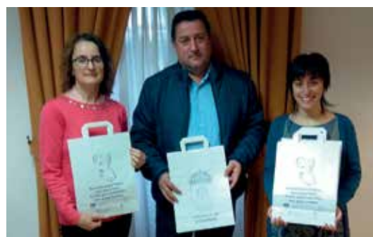
O CIM desenvolveu unha campaña dirixida ao comercio local