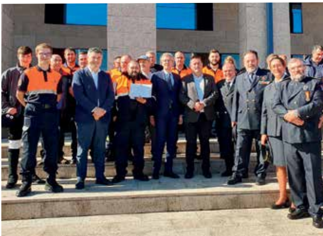
Integrantes de Protección Civil e autoridades, tras a entrega de Medallas