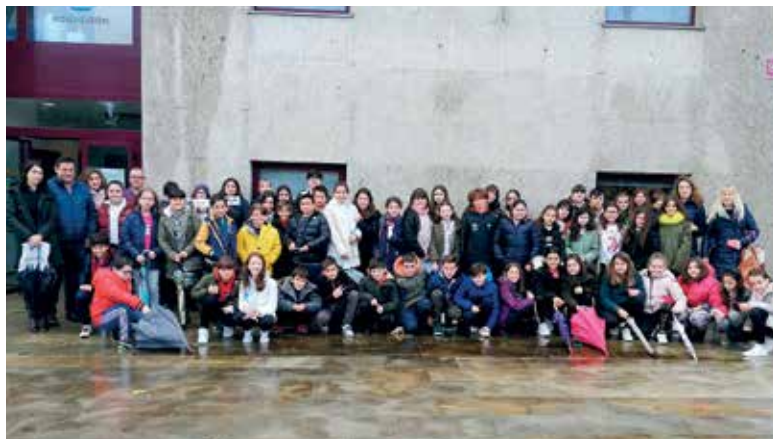
Alumnado e profesorado de 5º e 6º de Educación Primaria participante no V Pleno Infantil