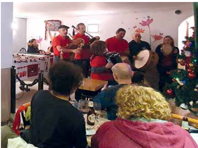
Unha das actuacións dos Cantos de Taberna dentro da VIII Ruta de Tapas

Unha vez compilados os folletos de participación do público, procederase á realización dos sorteos de ata 300 euros. O primeiro será un premio en metálico de 180 euros, aportado pola hostalería participante, e o segundo, un vale regalo por valor de 120 euros para canxear por unha comida ou unha cea no establecemento que resulte gañador desta VIII Ruta de Tapas.