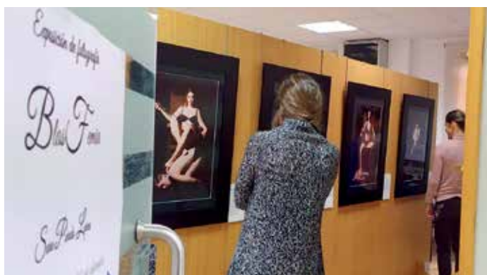
A exposición 'BlasFemia' estará aberta ao público ata o vindeiro 20 de decembro

integrados no CIM-, baixo o lema Neste local rexeitamos a violencia de xénero.