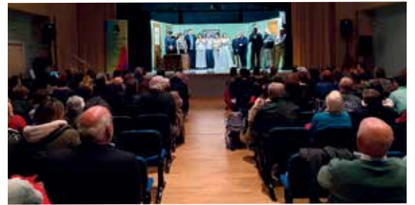
A sesión inaugural correu a cargo do Grupo de Teatro Licor Café