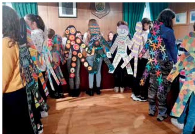
Siluetas que se amosaron na sesión para representar os dereitos infantís

O Concello de Boqueixón celebrou o seu V Pleno Infantil. Esta iniciativa, desenvolvida virtude dun convenio asinado con Unicef e organizada polo Departamento de Servizos Sociais, serviu para conmemorar o Día Internacional dos Dereitos dos Nenos e Nenas.