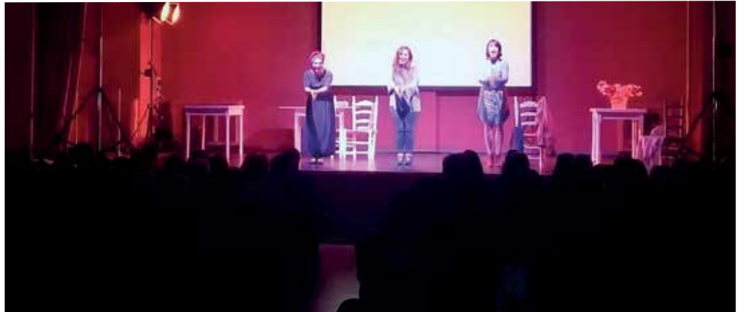
A posta en escena da obra 'Invisibles' da compañía Redrum Teatro congregou arredor de 200 persoas asistentes

Tamén esta mesma afluencia rexistrouse na