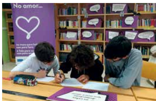
Obradoiro para o alumnado de ESO do CPIP Antonio Orza