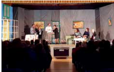
Actuación de Teatro Charamela de Melide