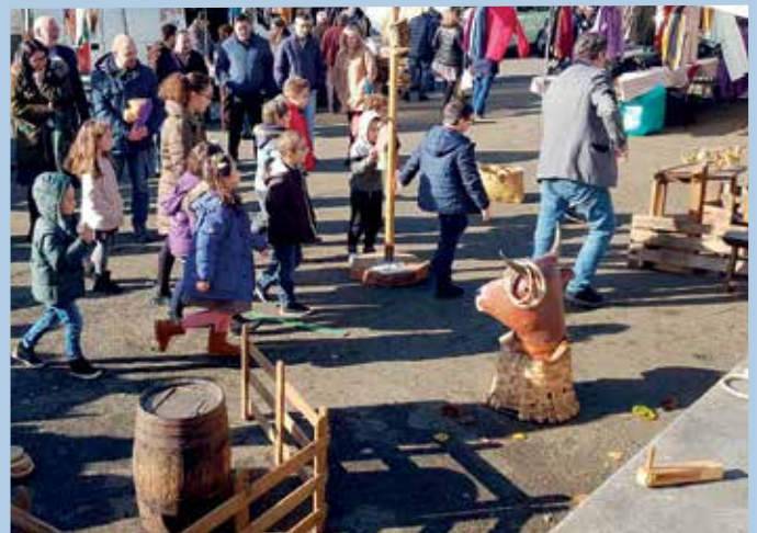
Un intre das propostas lúdicas dentro das 'Feiras Activas', en Lestedo

As propostas das Feiras Activas continuarán este domingo 8 no Campo da Feira de Rodiño (12.30 horas) co espectáculo Circa-nelo . Finalizarán o domingo 15 en Lestedo (12.30 horas) coas actuacións das agrupacións musicais Estralampo e Loira, pertencentes á Asociación Cultural Mestre Manuel Gacio.