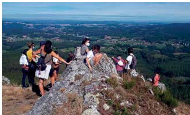
Asistentes a unha das visitas xeolóxicas realizadas ao Pico Sacro

O programa de visitas xeolóxicas guiadas continuará todos os domingos deste mes. O custo é de 10 euros/persoa, sendo de balde para menores de 12 anos. O prezo inclúe Guía Oficial de Turismo de Galicia e SRC. As prazas son moi limitadas e deberán realizarse as reservas en geoturgalicia@gmail.com ou no 675 820 520.