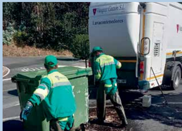
Acometeuse a limpeza de colectores nas distintas parroquias