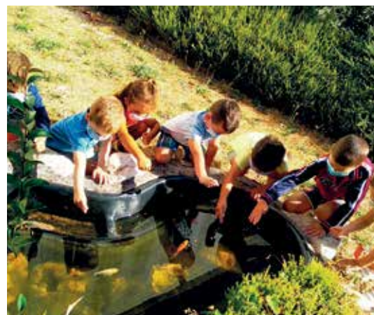
O Verán Activo priorizou as actividades no exterior