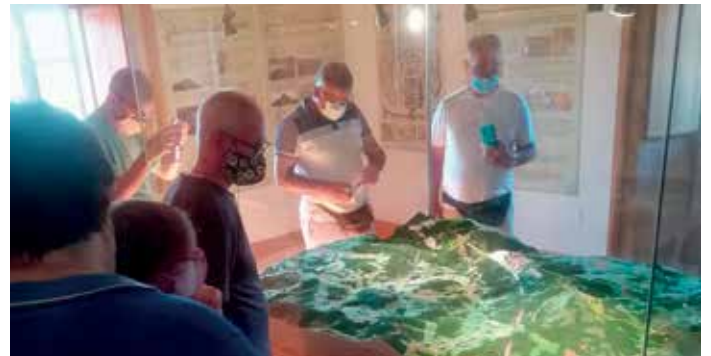
Outro dos puntos de interese é o Centro de Interpretación do Pico Sacro