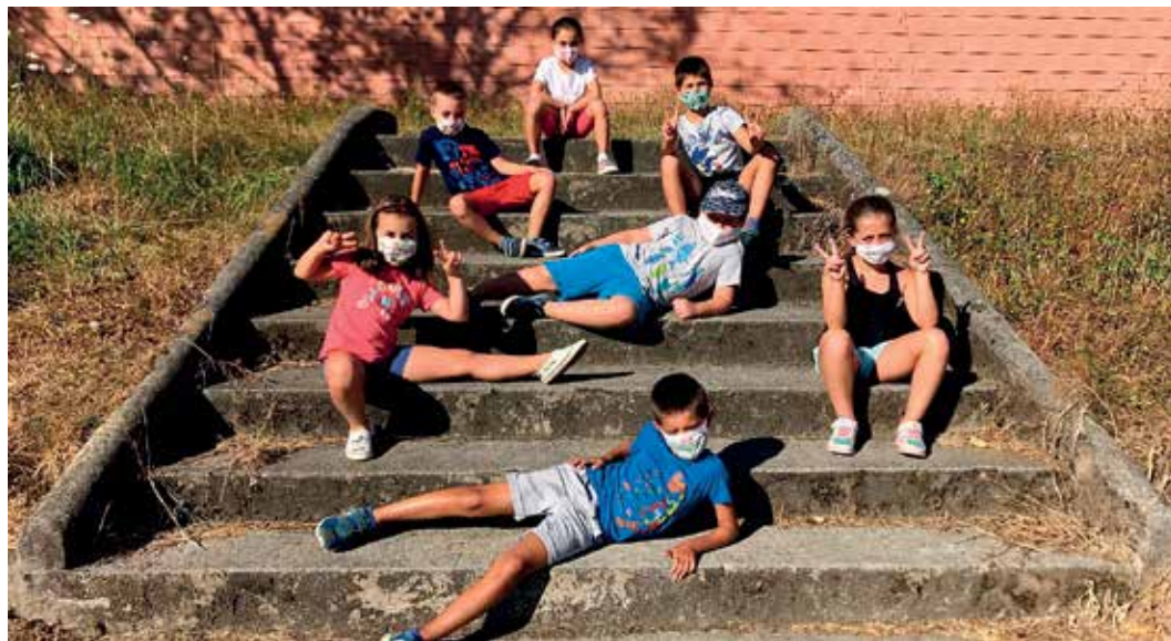
Co fin de garantir todas as medidas hixiénico-sanitarias as crianzas participantes dividíronse en varios grupos reducidos

Aínda que se tratou dun verán atípico, os rapaces e rapazas participantes puideron gozar de xornadas do máis amenas, reforzando a idea de que o xogo e a diversión non teñen por que estar reñidas coas necesarias medidas de prevención contra o coronavirus.