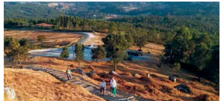
Visitantes accedendo ao Pico Sacro dentro das actividades deste programa