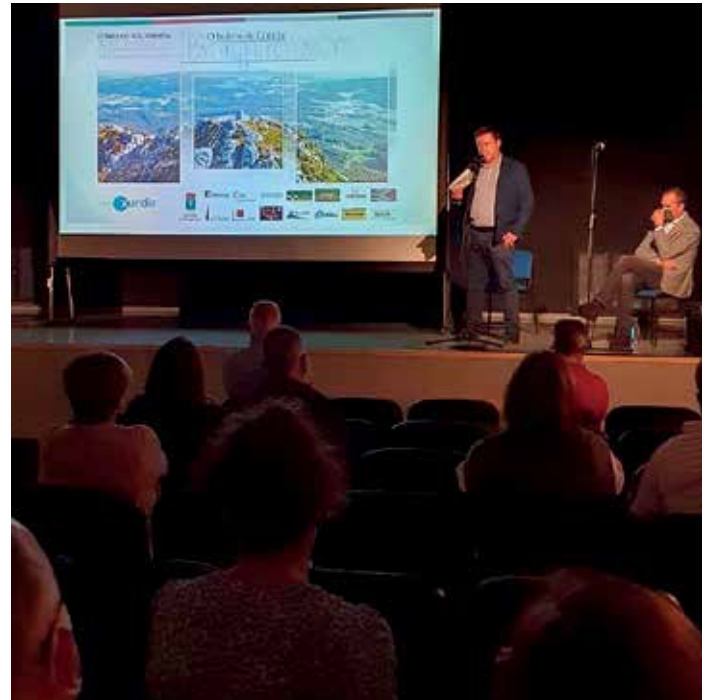
O alcalde de Boqueixón, durante a súa intervención na estrea do documental

Neste documental tamén ten cabida a cultura propia do municipio, que ten no Camiño de Santiago e o Entroido dos Xenerais da Ulla o seus principais expoñentes. Así mesmo, falarase da súa gastronomía, representada pola Filloa da Lestedo, ademais da ampla oferta gastronómica e de aloxamentos turísticos á disposición de visitantes.