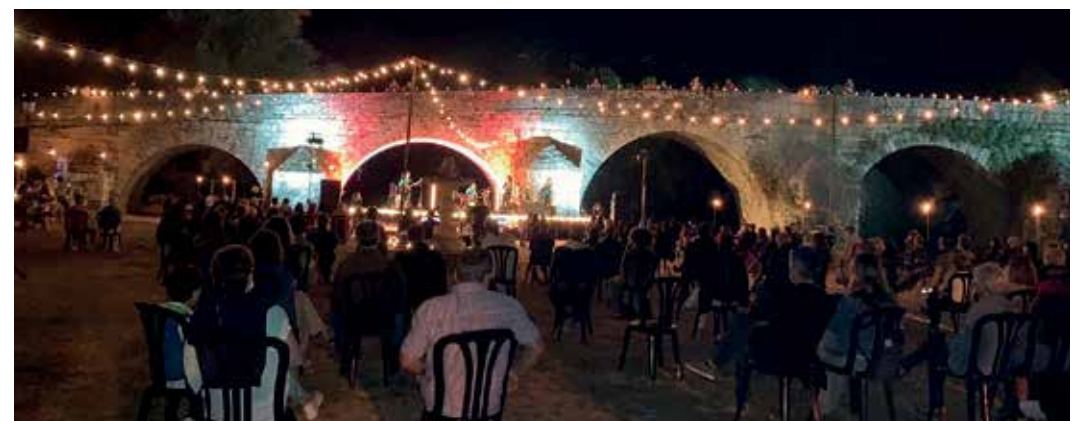
Co fin de cumprir coas medidas hixiénico-sanitarias limitouse o aforo e colocáronse as cadeiras separadas