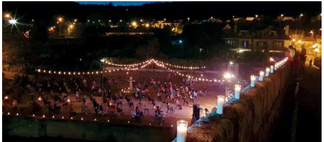
A ponte medieval ilumínase cun total de trescentas candeas dispostas ao longo deste fermoso paso

Dende o Concello de Boqueixón amósanse moi satisfeitos pola excelente resposta por parte da veciñanza a esta iniciativa. Ademais, agradecen que todas as persoas asistentes cumprisen coas medidas de seguridade.