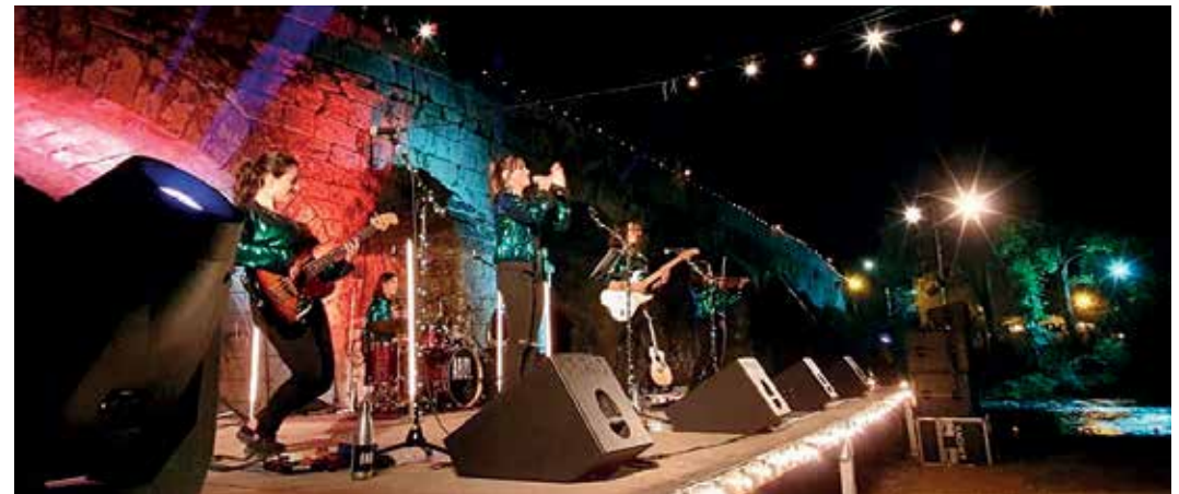
A Banda da Loba encargouse de amenizar a 'Noite Velada' de Ponte Ledesma cun concerto que fixo as delicias do público