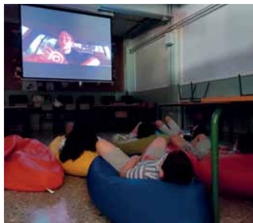
Un intre dunha sesión de cine cunha proxección