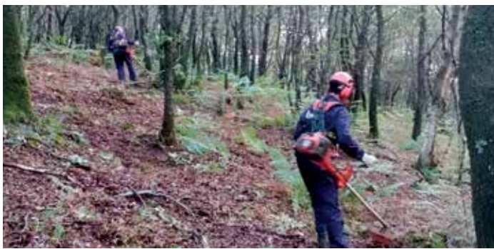
Operarios dunha das brigadas desbrozando no castro de Gastrar

As principais tarefas que se desenvolven, toda vez que non se produciron incendios no territorio, comprenden o desbroce e limpeza de montes e pistas.