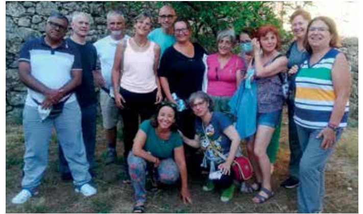
Un grupo de peregrinos que solicitou unha das visitas guiadas de balde

Dende o Concello lembran que os/as participantes deberán cumprir con todos os protocolos de prevención contra a COVID-19.