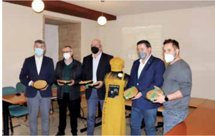
Presentación da XXIX Festa da Filloa na Hospedería San Martín Pinario

Neste sentido, a organización contará cunha empresa especializada que se encargará de que se cumpra en todo momento a normativa preventiva fronte á Covid-19 e de que non se produza ningún tipo de masificación no campo da festa.