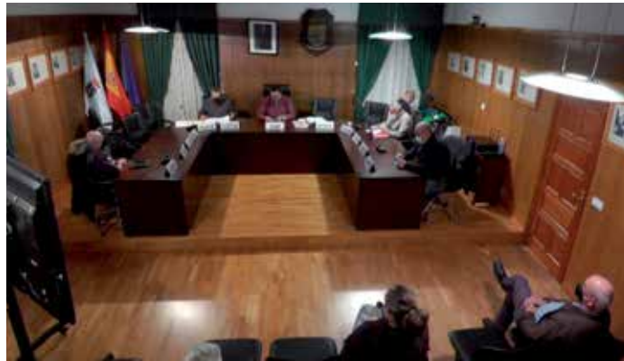
As obras foron aprobadas cos votos a favor do PP e o voto en contra de Veciños

Os 198.737,4€ da Achea 2021 investiranse en dous proxectos de obras de mellora do firme de 21 camiños. Así, o proxecto “Mellora do firme do acceso á Carballeira (Sucira) e outros” investirá 104.150,3€ na mellora do firme dunha dúcia de viarios: acceso á Carballeira (Sucira), interiores en Reboredo, camiño en Maravexás, camiño de Casalvieito á AC-240, camiño da Fonte de Loureiro, camiño da AC-240 ata o límite con Touro, camiño da AC-960 a Mato, interiores en Vilaboa, interior en Senande, camiño da AC-261