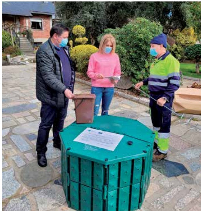
Entrega dun dos composteiros adquiridos polo Concello de Boqueixón

Aquelas persoas que non o recibiran por non estaren neses momentos na casa, poden solicitar o seu composteiro no Concello ou en compostaxe@boqueixon.com , achegando un formulario que atoparás na web municipal: www.boqueixon.gal .