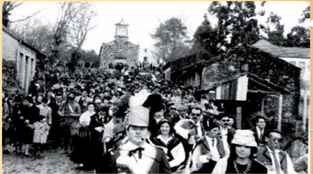
Foto e texto recollidos do libro "Boqueixón. Música e Tradición". José M o Cebeiro Fernández e Xosé Francisco Noia Souto

Tradicionalmente, os Xenerais da Ulla teñen a súa propia organización e forma de levar a festa. Estes personaxes desprázanse en forma de "columna" e van ben acompañados. De primeiro van os correos, encargados de anunciar as máscaras. Séguenos dous xinetes a cabalo que presentan os Coros de bonitos e vellos. Estes coros van acompañados de músicos e todos interpretan cantares mentres camiñan na formación. Finalmente, pechando a comitiva van os esperados Xenerais.