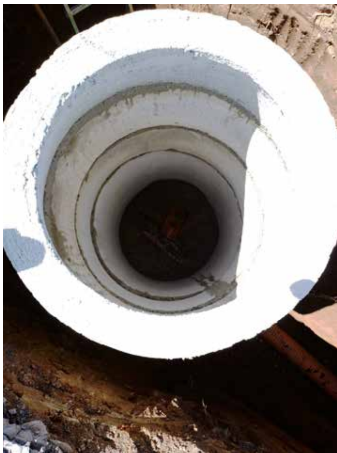
Actuación de saneamento realizada este ano en Quián