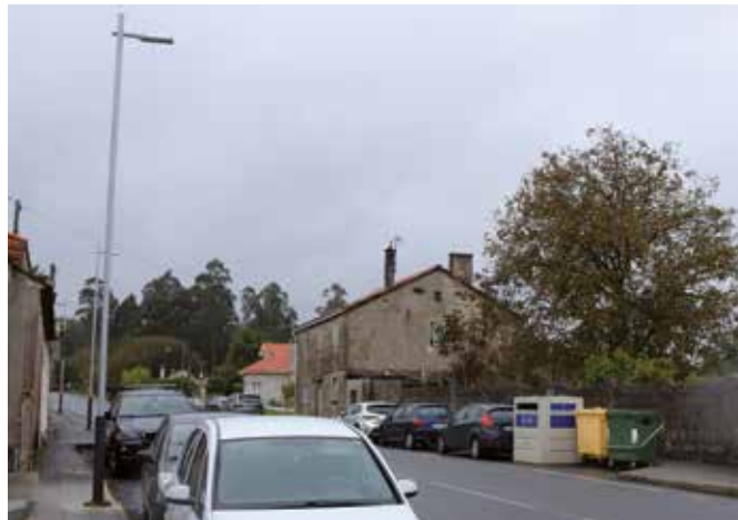
As novas luminarias reducirán a contaminación lumínica e ambiental

“Grazas a estas actuacións lograremos unha considerable rebaixa no custe do alumado público e estaremos tamén coidando o nos medio ambiente ao reducir o consumo enerxético e dispoñer dunha tecnoloxía dunha vida útil máis longa, que non contén materiais contaminantes e que é totalmente reciclable”, explica o alcalde, Ovidio Rodeiro. En concreto, o proxecto permitirá actuar en 125 centros de mando que dan servizo a un total de 2.652 farolas.